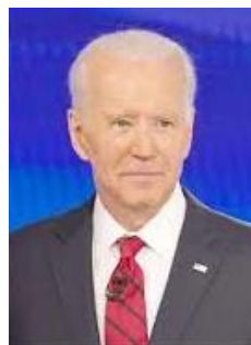
(バイデン)